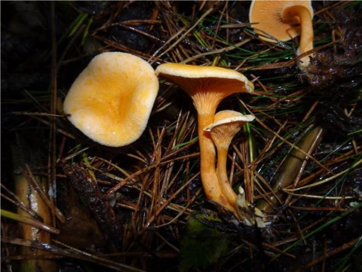
Dit zijn Valse hanekammen de deugenieten!