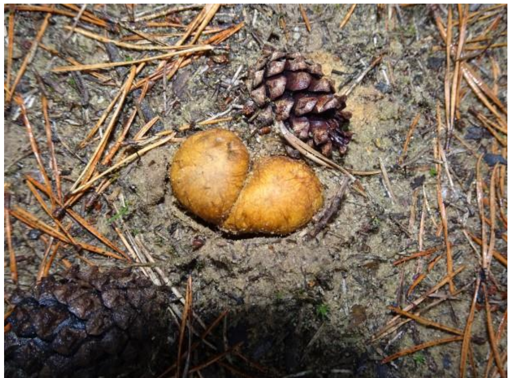
In zijn buurt deze Okergele vezeltruffel