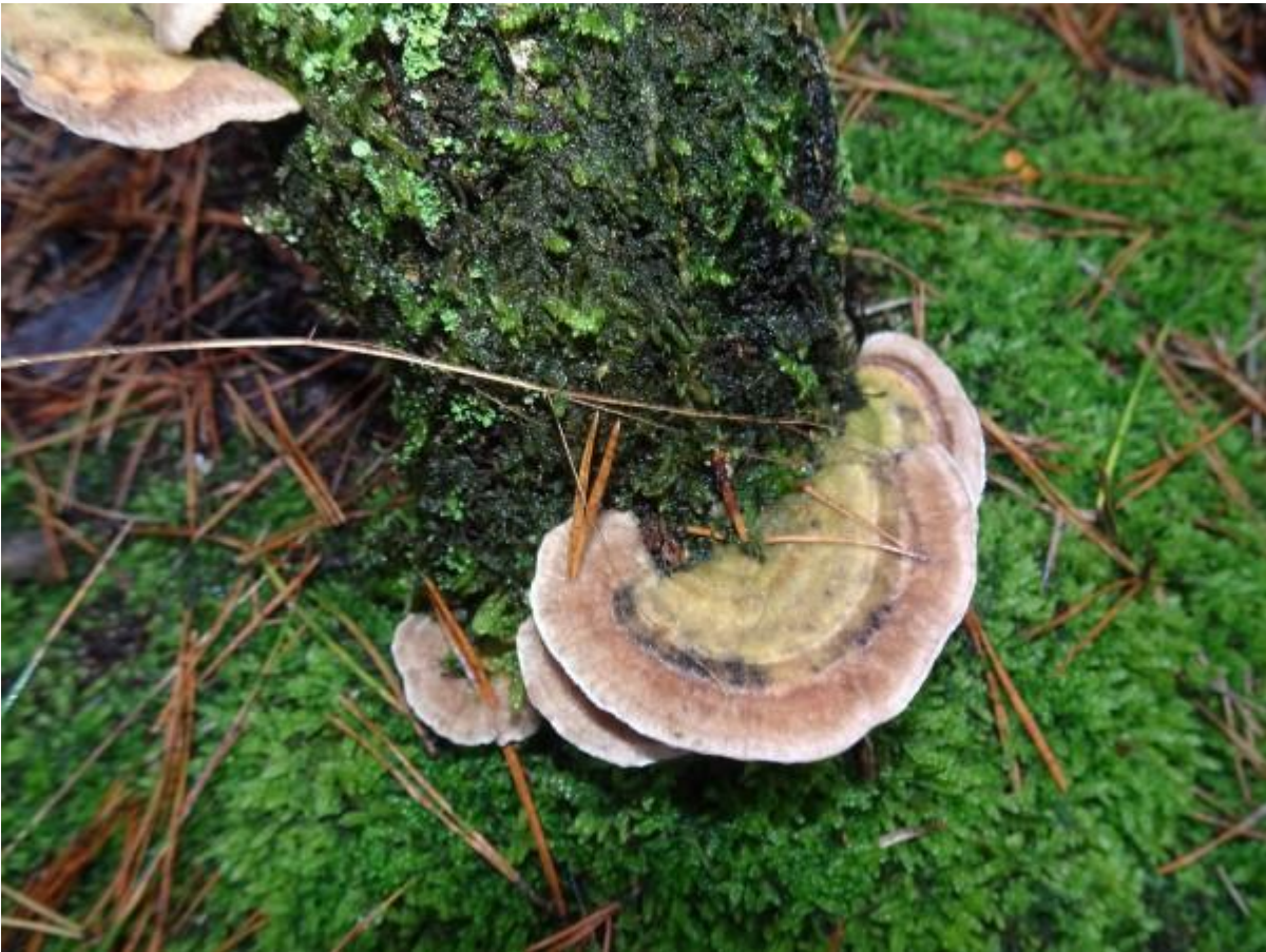
Het stond er vol deugenieten zoals dit Fopelfenbankje