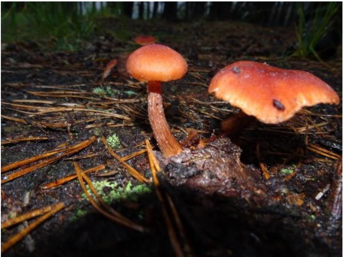
Nog zo'n deugeniet deze Schubbigе fopzwam