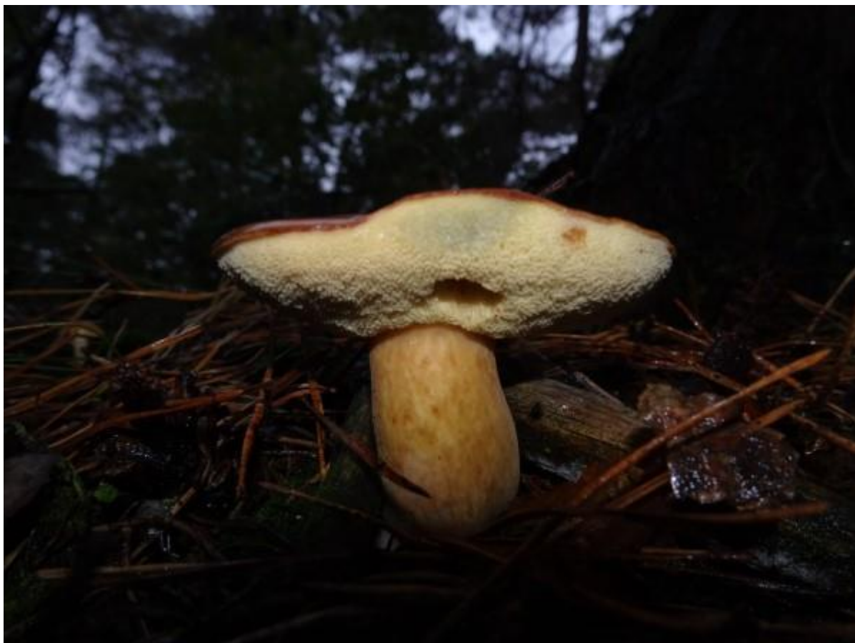
Een Kastanjeboleet wie goed kijkt ziet dat hij blauw kleurt waar hij ingedrukt werd