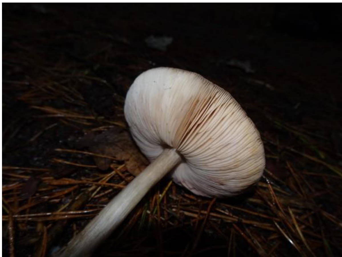
De Gewone hertenzwam