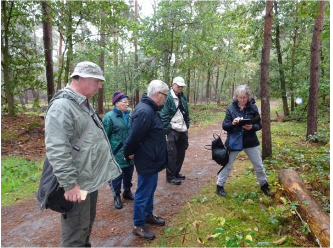
Ze stonden erbij en keken ernaar deze Slobkousjes