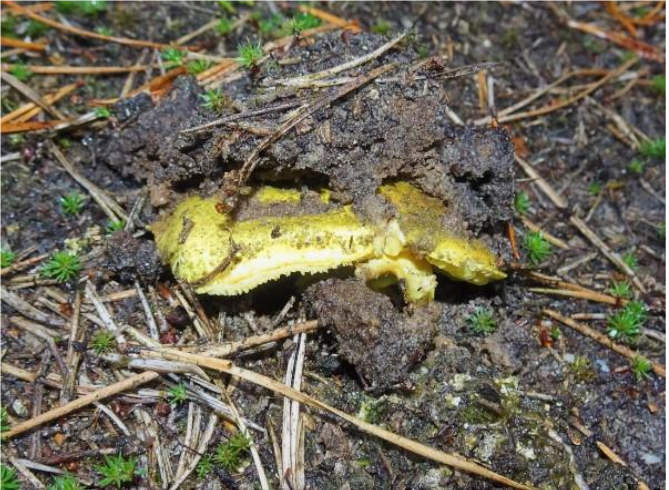
Hier is hij dan onze gele ridderzwam