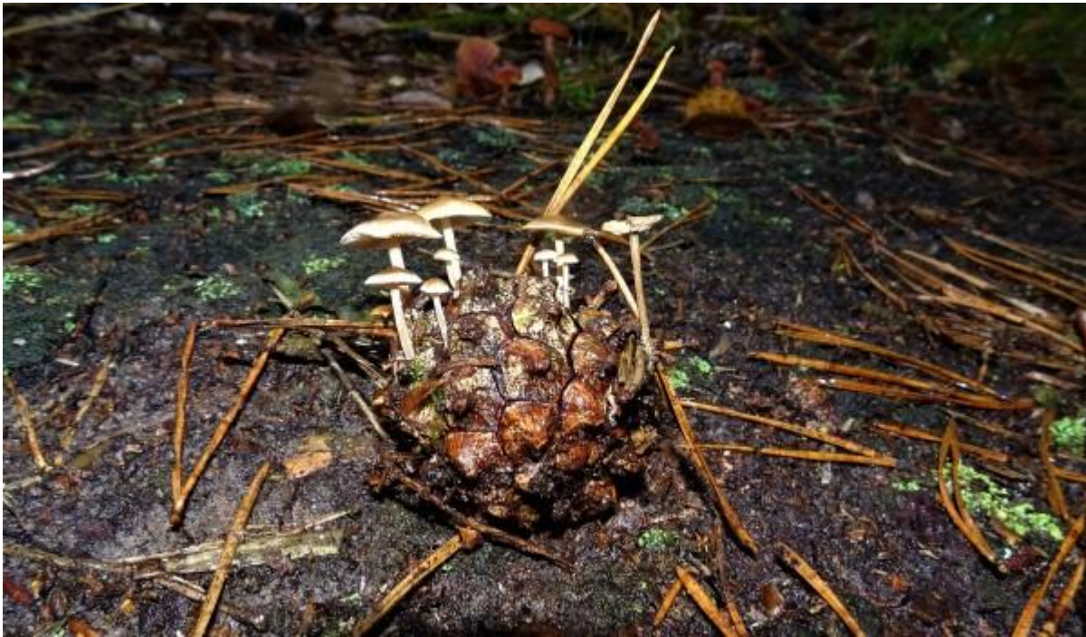
Altijd liefdig deze Muizenstaartjes