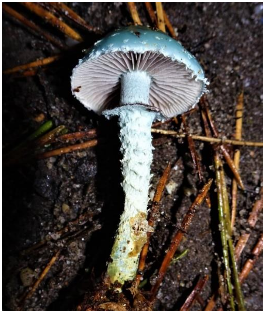
Een leuke vondst was deze Echte kopergroenzwam